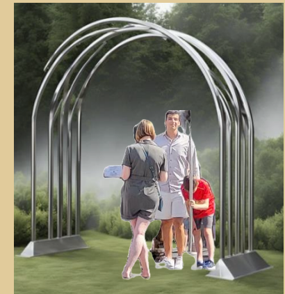
Modell aus mehreren halben Modulen. Halbbögen können nach Wunsch zusammengestellt werden und sind auch einzeln einsetzbar